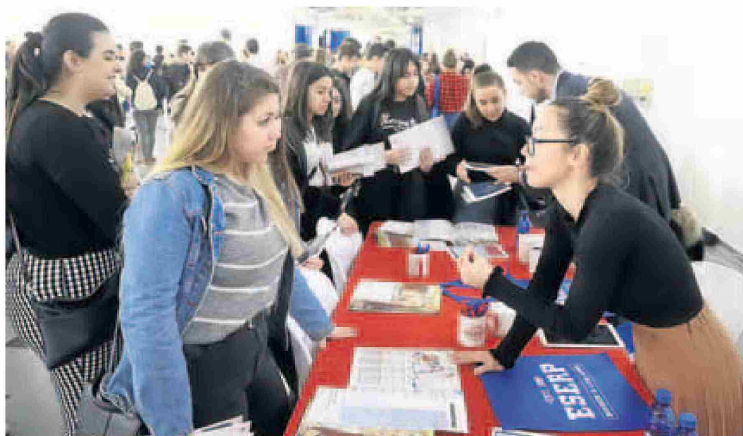
Un grupo de estudiantes solicita información en uno de los expositores de la feria.