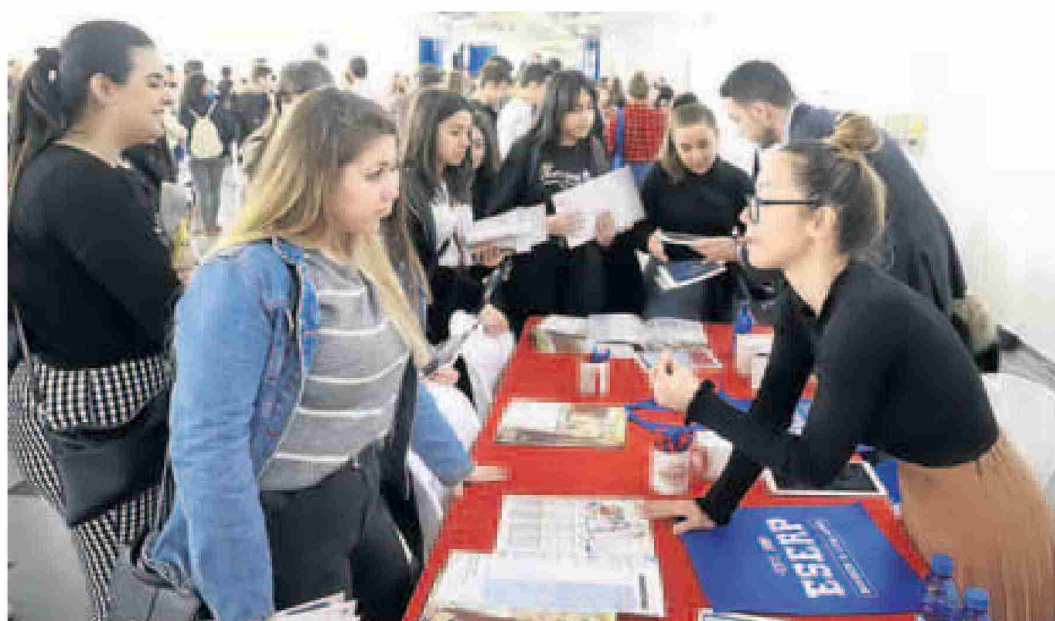
Un grupo de estudiantes solicita información en uno de los expositores de la feria.