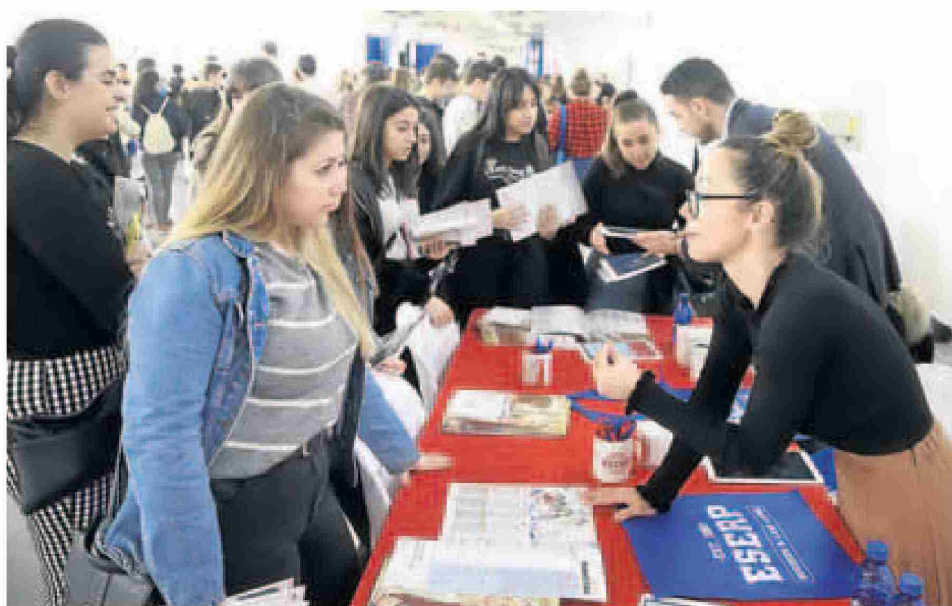
Un grupo de estudiantes solicita información en uno de los expositores de la feria.