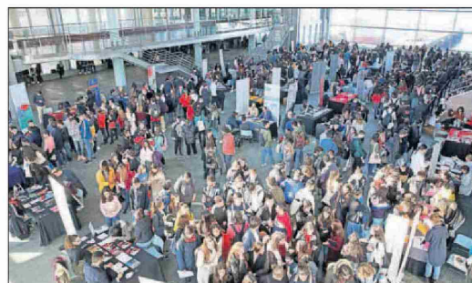
Participantes en la feria, ayer, en el Mar de Vigo.

Centenares de jóvenes de los distintos centros educativos de la ciudad se desplazaron al auditorio para intentar despejar su futuro. Como Javier, Mar, Andrés y Brais, que cursan este año segundo de bachillerato en el colegio Santiago Apóstol, y todavía están indecisos. "No sabemos por dónde tirar, esperamos que esta feria nos ayuden", explica Mar.