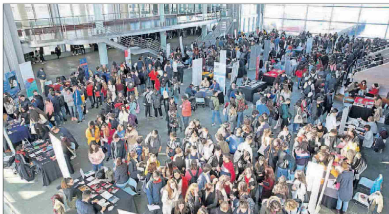
Los estudiantes, ayer en los stands que las universidades montaron en el Mar de Vigo.