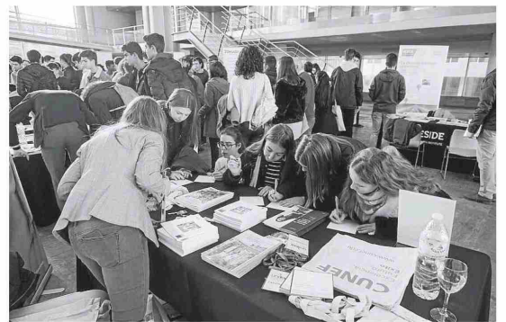
Los estudiantes tomaron nota de la información recibida.

La Feria de Orientación Universitaria, que cumple su 14 edición, recorre 24 ciudades españolas, cuatro italianas, tres mexicanas, una portuguesa y Andorra. Vigo se ha convertido en una parada fija de este certamen que aprovechan numerosos centros educativos de la comarca, que además fletan autobuses para acudir al Auditorio. ■