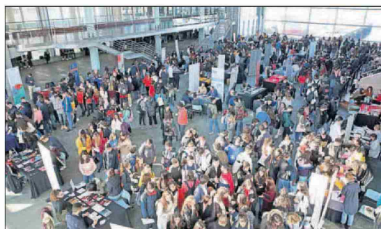
Participantes en la feria, ayer, en el Mar de Vigo.

Centenares de jóvenes de los distintos centros educativos de la ciudad se desplazaron al auditorio para intentar despejar su futuro. Como Javier, Mar, Andrés y Brais, que cursan este año segundo de bachillerato en el colegio Santiago Apóstol, y todavía están indecisos. "No sabemos por dónde tirar, esperamos que esta feria nos ayuden", explica Mar.