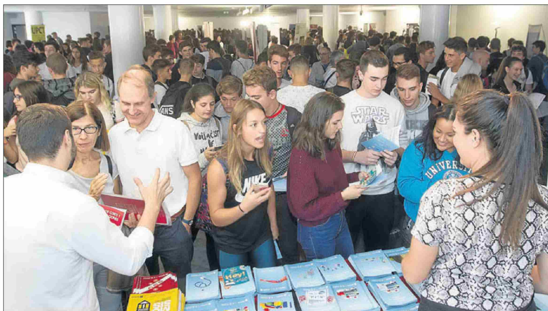
Los asistentes podrán informarse en los stands de los centros públicos y privados de la provincia y del resto de España. ALEX DOMÍNGUEZ