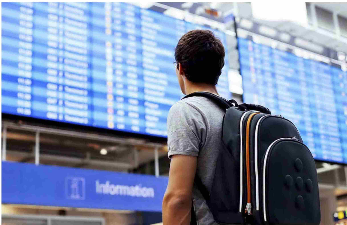
Uno de cada 10 alumnos nacionales de los últimos cursos del instituto asegura que escogerá su carrera en función del dinero que pueda llegar a ganar.

EMPLEO | LA ASPIRACIÓN PROFESIONAL DE LAS NUEVAS GENERACIONES