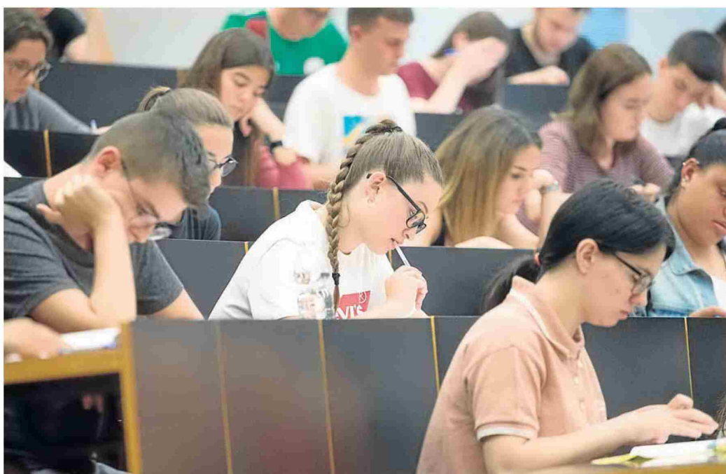
Un grupo de jóvenes hacen las pruebas de acceso a la universidad en Barcelona

En el extremo contrario se encuentran los sevillanos: el 38% aceptaría su primer puesto por un sueldo anual de 15.000 euros, se-