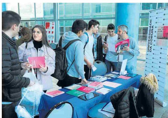
Estudiantes en la última edición de Unitour en Palexco