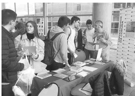
Estudiantes en la última edición de Unitour en Palexco