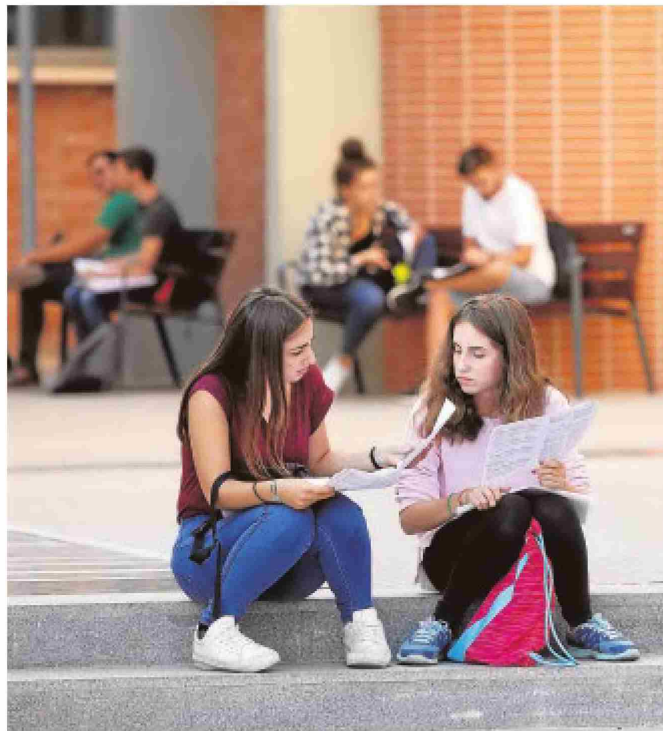
Dos jóvenes repasan en la facultad de Medicina en 2018

La aspiración general es lograr la máxima puntuación posible a fin de no cerrarse puertas en un contexto tan competitivo como el de las notas de corte. Más aún teniendo en cuenta que, según un reciente estudio elaborado por el Salón de Orientación Universitaria Unitour, el 75 por ciento de los estudiantes de Bachillerato cordobeses no tiene claro qué grado estudiará. Solo un cuarto del estudiantado tiene claro su objetivo. El resto se divide