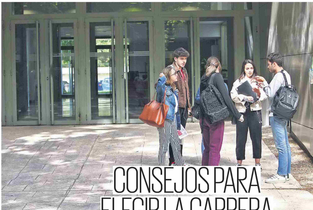
ESTUDIANTES EN LA UCA (LONDRES, PAIS)