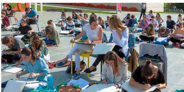
UNIVERSIDAD DE NAVARRA

Los preuniversitarios estudian en base a sus ideales, pero no olvidan el futuro. Para asegurarse unos ingresos mensuales, una vez terminado el grado, casi uno de cada cuatro españoles intentaría ser funcionario. Según el citado informe de la consultora Circulo de Formación, que organiza el Salón de Orientación Universitaria Unitour desde hace 13 años, cada vez más jóvenes quieren que su sueldo dependa de la Administración Pública. El mismo porcentaje prefiere no tener jefe y optaría por emprender su propio negocio.