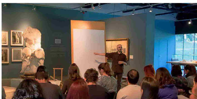
UNIVERSIDAD COMPLUTENSE DE MADRID