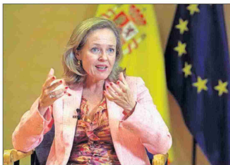
La vicepresidenta Nadia Calviño, en el Summit 2020 de DigitalES.

La ministra sostuvo que la colaboración público-privada es "absolutamente indispensable"