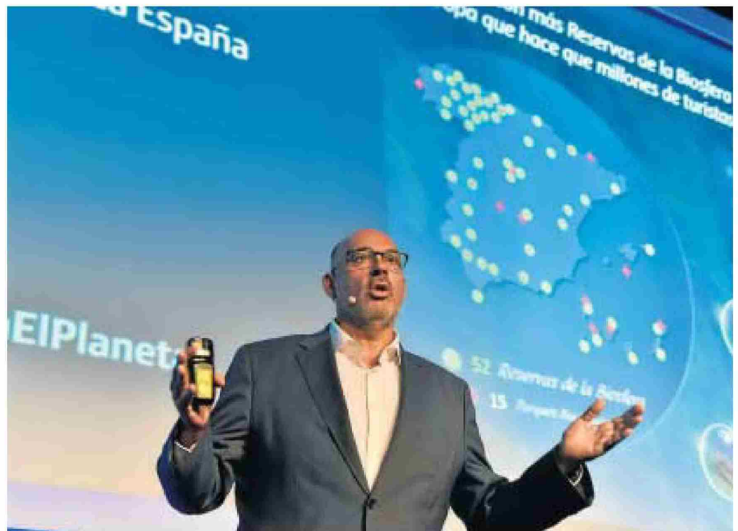
El presidente de Telefónica España, Emilio Gayo.

Por este motivo, Gayo insistió en la importancia del sector de las telecomunicaciones y su desarrollo. “Aunque la fibra en España llega a más del 83% de la población, miramos al futuro con nuestro despliegue del 5G, que alcanzará este año al 75% de la población. Este esfuerzo complementa-