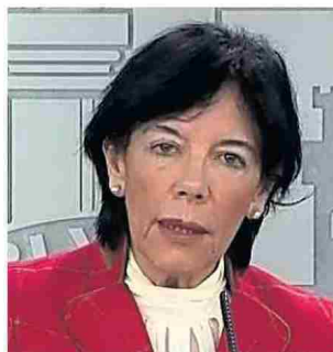
MODERNIZACIÓN. La ministra de Educación, Isabel Celaá.

Celaá participó, a través de un vídeo, en el evento DIGITALS Summit, en donde defendió la “alfabetización múltiple del siglo XXI” con la que, a su juicio, hay que “superar la lectoescritura y las matemáticas” y hay que poner la digitalización como “elemento nuclear”. Señaló que el Ministerio trabaja para proporcionar a los alumnos más vulnerables “los recursos electrónicos que necesitan” a través del programa Educa