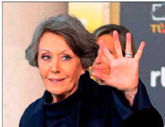
Rosa María Mateo, administradora actual de RTVE.

RTVE vende 28 inmuebles a través del portal Idealista, edificios que sumarían 20 millones de euros. Entre los edificios, se encuentra un dúplex de 1.265 m 2 en Valencia, valorado en más de 5 millones de euros y que ha servido para alojar la emisora pública. Además, la