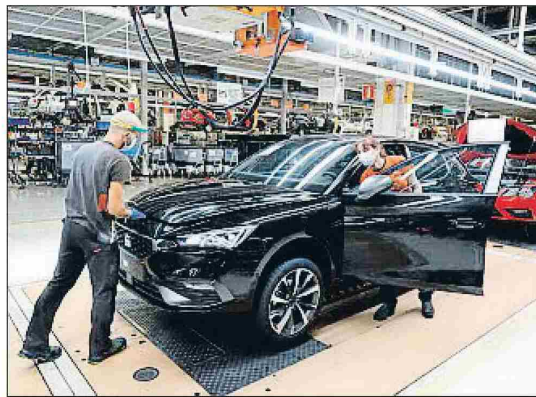
Dos trabajadores con protección, en la planta de Martorell

De acuerdo con las previsiones, el próximo lunes arrancará un segundo turno de producción en cada una de las líneas, lo que permitirá fabricar 650 coches diarios. La automovilística calcula que hasta junio no podrá recuperar, con sus 15.000 empleados, el ritmo de producción anterior a la crisis. El comité de empresa retiró ayer una denuncia que había presentado ante la Inspección de Trabajo al entender que en el plan gradual de regreso a la actividad se cumplen todas las medidas de prevención y seguridad sanitaria necesarias.●